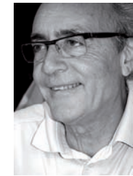
Juan José Millás

Periodista y escritor valenciano, galardonado con el premio de periodismo Francisco Cerecedo, el premio Planeta por su novela autobiográfica El mundo y con el premio Nacional de Narrativa. Otras obras son Los objetos nos llaman , Laura y Julio , El ojo de la cerradura , No mires debajo de la cama , El jardín vacío .