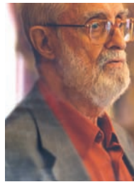
José Luis Sampedro

Los libros nos llevan a mundos que nunca disfrutaríamos sin ellos”.