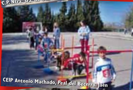
CEIP Antonio Machado, Peal del Becerro. Jaén