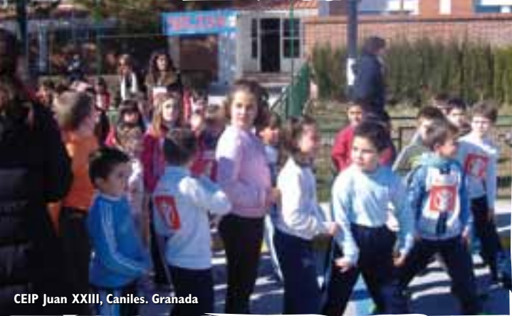
CEIP Juan XXIII, Caniles, Granada