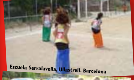
Escuela Serralavella, Ullastrell. Barcelona