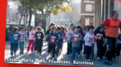
Escola Marta Mata, Viladecans. Barcelona