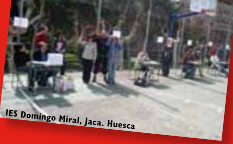
IES Domingo Miral, Jaca. Huesca