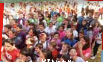
CEIP Juan de Mairena. Sevilla