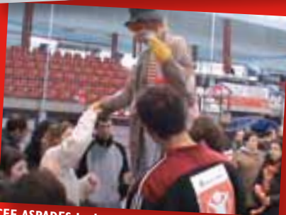
CCEE ASPADES La Laguna, Puertollano. Ciudad Real