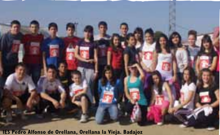
IES Pedro Alfonso de Orellana, Orellana la Vieja, Badajoz