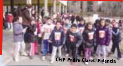
CEIP Padre Claret. Palencia