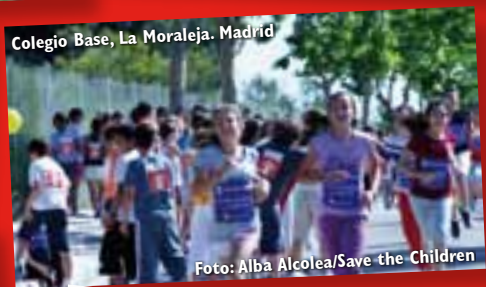
Colegio Base, La Moraleja. Madrid