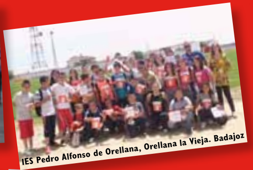
IES Pedro Alfonso de Orellana, Orellana la Vieja. Badajoz