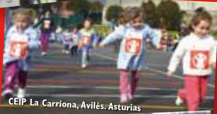
CEIP La Carriona, Avilés. Asturias