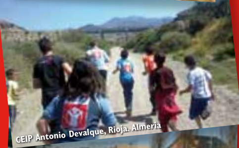
CEIP Antonio Devalque, Rioja. Almeria