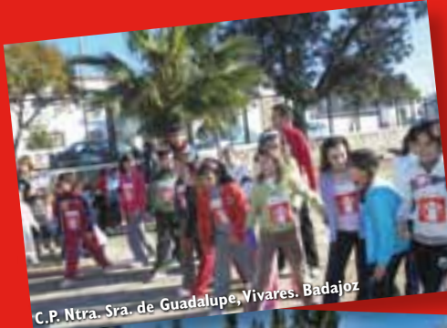
C.P. Ntra. Sra. de Guadalupe, Vivares. Badajoz