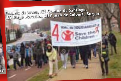
Escuela de Artes, IES Camino de Santiago, IES Diego Porcelos, CIFP Juan de Colonia. Burgos