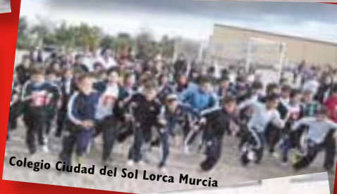
Colegio Ciudad del Sol Lorca Murcia