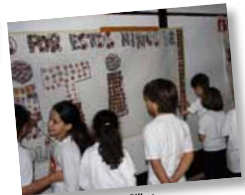
Colegio Pureza de Maria. Bilbao