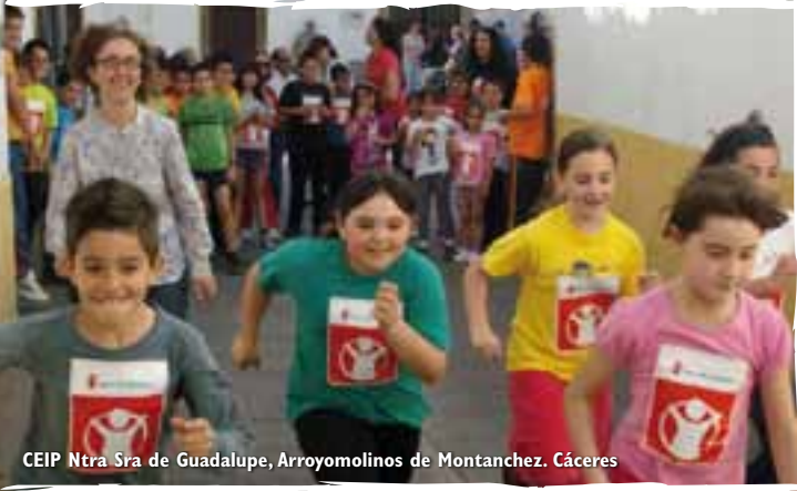
CEIP Ntra Sra de Guadalupe, Arroyomolinos de Montanez, Cáceres