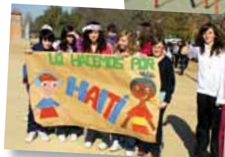
IES Fuerte de Cortadura. Cádiz