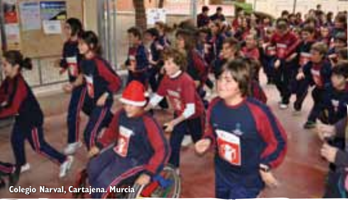
Colegio Narval, Cartagena, Murcia