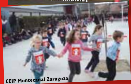
CEIP Montecanal Zaragoza