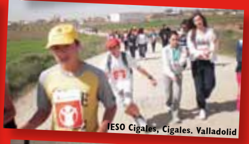
IESO Cigales, Cigales. Valladolid