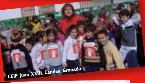
CEIP Juan XXIII, Caniles. Granada