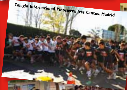
Colegio Internacional Pinosierra Tres Cantos. Madrid