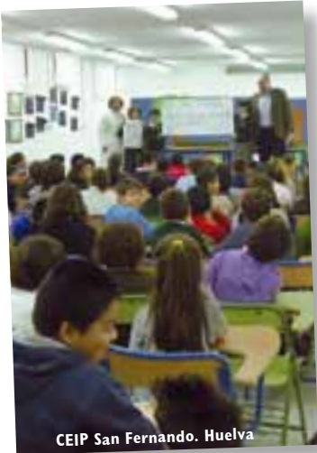
CEIP San Fernando. Huelva