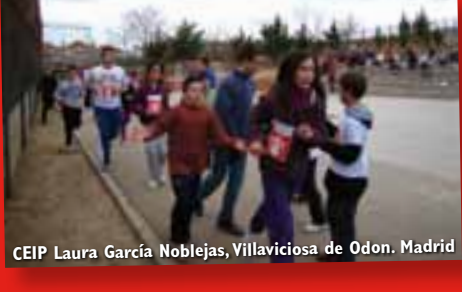
CEIP Laura García Noblejas, Villaviciosa de Odon. Madrid