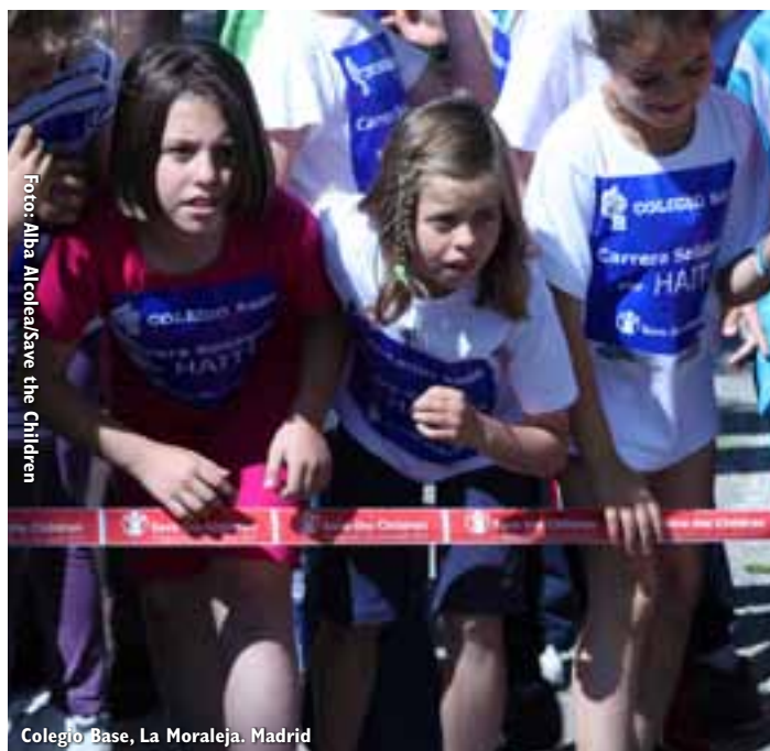
Colegio Base, La Moraleja. Madrid

ALBERITE CEIP AVELINA CORTÁZAR ALDEANUEVA DE EBRO CEIP MIGUEL ANGEL SAINZ ALFARO IES GONZALO DE BERCEO ARNEDO IES VIRGEN DE VICO CALAHORRA IES VALLE DEL CIDACOS EZCARAY CEIP SAN LORENZO HARO IES MARQUÉS DE LA ENSENADA LOGROÑO IES DUQUES DE NÁJERA MURILLO DE RÍO LEZA CEIP ELADIO DEL CAMPO NÁJERA CEIP SANCHO III EL MAYOR PRADEJÓN IES MARCO FABIO QUINTILIANO