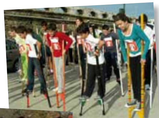
IES Fuerte de Cortadura. Cádiz

Los alumnos y alumnas buscarán después patrocinadores en su entorno cercano que les aporten una cantidad por cada “kilómetro simbólico” recorrido. De esta manera, se consigue el objetivo de transmitir, más allá del Centro, lo aprendido e interiorizado, transformándose en una ONG capaz de sensibilizar a su comunidad. Todo este esfuerzo colectivo se convierte en recursos destinados a la infancia desfavorecida.