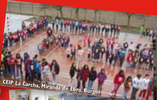
CEIP La Carcha, Miranda de Ebro. Burgos