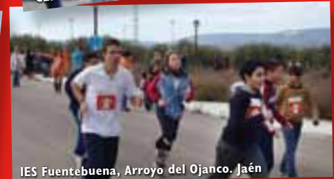
IES Fuentebuena, Arroyo del Ojanco. Jaén