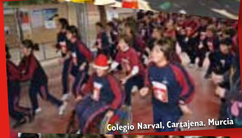
Colegio Narval, Cartajena. Murcia