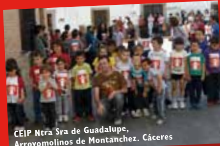
CEIP Ntra Sra de Guadalupe, Arroyomolinos de Montanez. Cáceres