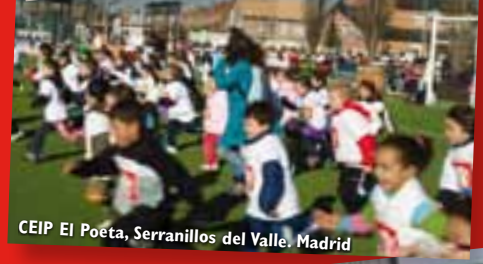
CEIP El Poeta, Serranillos del Valle. Madrid