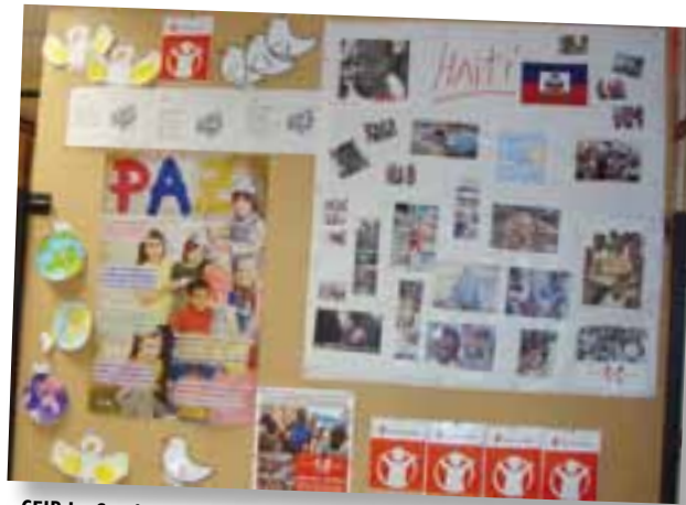
CEIP La Carcha, Miranda de Ebro. Burgos