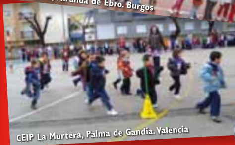
CEIP La Murtera, Palma de Gandía. Valencia