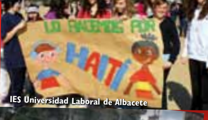
IES Universidad Laboral de Albacete