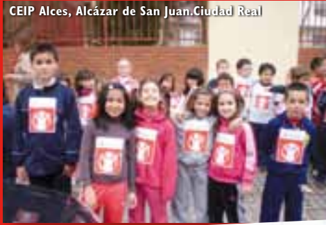
CEIP Alces, Alcázar de San Juan. Ciudad Real