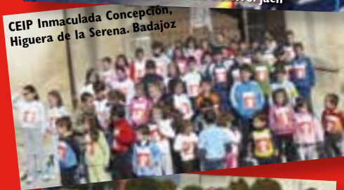
CEIP Inmaculada Concepción, Higuera de la Serena. Badajoz