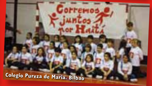
Colegio Pureza de Maria. Bilbao