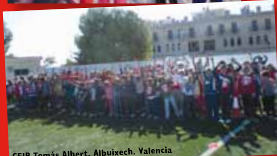
CEIP Tomás Albert, Albuixech. Valencia