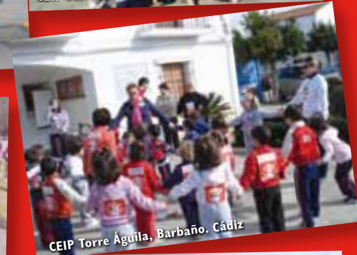
CEIP Torre Águila, Barbaño. Cádiz