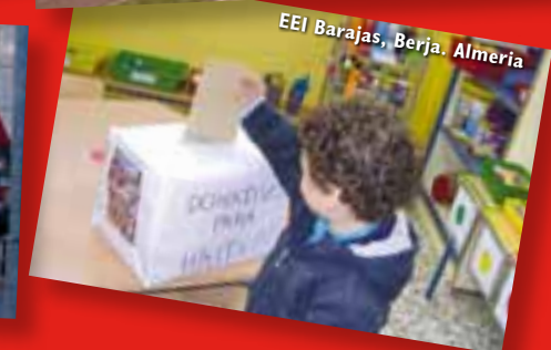
EEl Barajas, Berja. Almeria