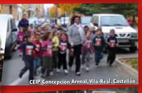
CEIP Concepción Arenal, Vila-Real. Castellón