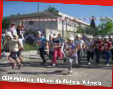
CEIP Palancia, Algimia de Alafara. Valencia