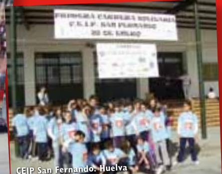
CEIP San Fernando. Huelva