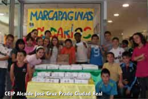
CEIP Alcalde José Cruz Prado Ciudad Real