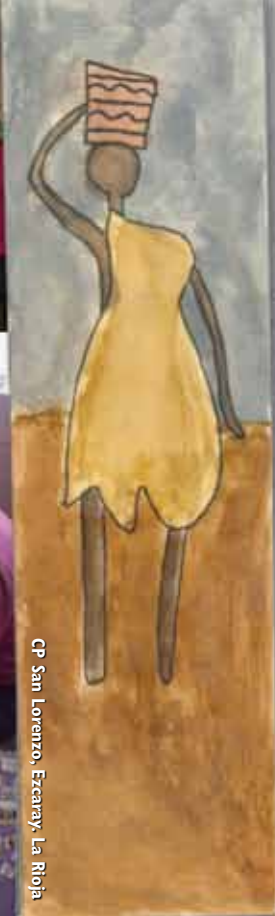
CP San Lorenzo, Ezcároz, La Rioja