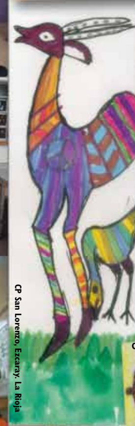
CP San Lorenzo, Ezcároz, La Rioja