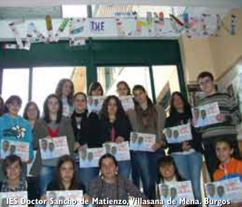
IES Doctor Sancho de Matienzo, Villasana de Mena, Burgos