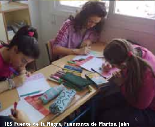
IES Fuente de la Negra, Fuensanta de Martos. Jaén