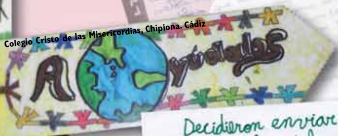
Colegio Cristo de las Misericordias, Chipiona, Cádiz