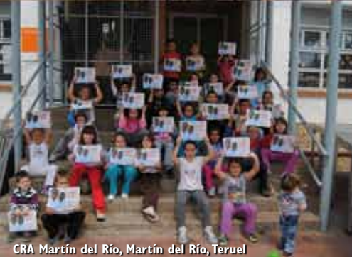
CRA Martín del Río, Martín del Río, Teruel