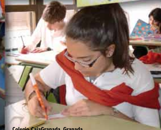
Colegio CajaGranada. Granada