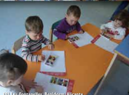
EEI Les Fontanelles, Benidorm. Alicante