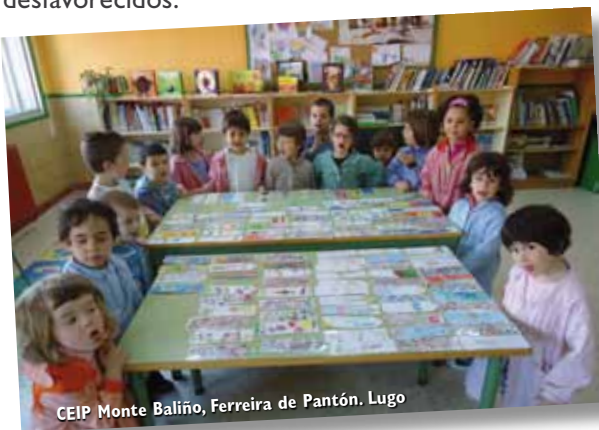
CEIP Monte Balño, Ferreira de Pantón. Lugo

La participación en esta III edición ha supuesto que 508 Centros Escolares de educación infantil, primaria y secundaria, 101.717 alumnos y alumnas y 6.154 profesores se hayan movilizado para convertir el Día del Libro en una nueva oportunidad para la solidaridad con los más desfavorecidos.