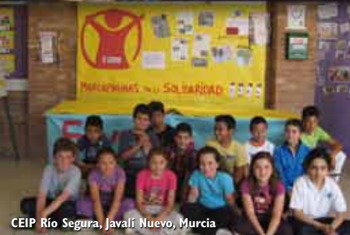
CEIP Río Segura, Javalí Nuevo, Murcia