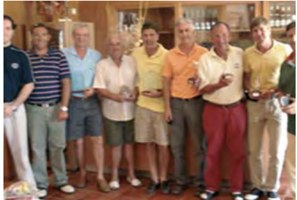
Torneo Marina Golf Mojacar (Almería).