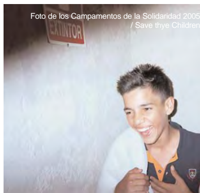
Foto de los Campamentos de la Solidaridad 2005

En el verano de 2007 se realizarán campamentos urbanos en Illescas (Toledo) y Leganés (Madrid) para 400 niños y niñas, así como la gestión de un albergue juvenil en Arroyomolinos de la Vera (Cáceres), donde este año son los grupos de tiempo libre con quienes Save the Children trabaja durante todo el año, quienes van a organizar sus propios campamentos durante el mes de julio.