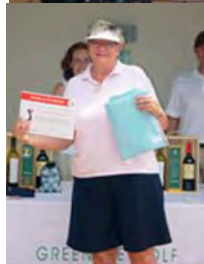
Torneo de GreenLife Golf (Málaga).