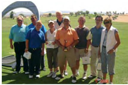
Torneo Club de Golf Hacienda del Álamo (Murcia).