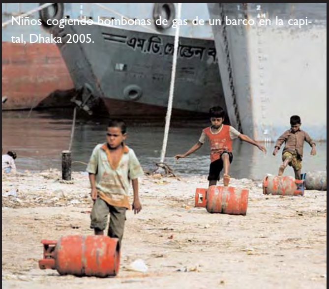
Niños cogiendo bombonas de gas de un barco en la capital, Dhaka 2005.