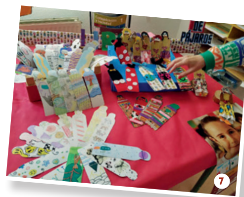
7. IES Beatriu Fajardo, Alicante.

Cada curs us supere en creativitat i en solidaritat!