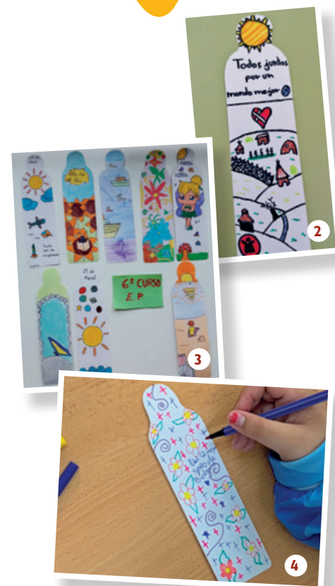
1. IES Mar Azul, Almería. 2. IES Delgado Hernández, Huelva. 3. Colegio Sagrado Corazón de Jesús, Jaén. 4. IES Pablo Picasso, Sevilla.