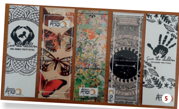
5. IES Domingo Rivero, Las Palmas.

Las Palmas: IES Blas Cabrera Felipe, CEIP Bañaderos, IES Arucas-Domingo Rivero, IES Casas Nuevas, CEIP Morro Jable, CEIP Guenia, Colegio Heidelberg, CEIP Santa Barbara, CPEIPS San Vicente de Paul, IES Siete Palmas, Colegio San Rafael, Colegio Saucillo, Colegio Almas, Colegio Arenas Atlántico, CEO Rey Juan Carlos I. Santa Cruz De Tenerife: CEIP Ntra. Sra. de La Luz, CEIP Botazo, CEIP Guayonge, CEIP Chirche, IES Mencey Acaymo, CEIP Julio Delgado Delgado, IES San Marcos, IES Cruz Santa, CEIP Las Ledas, IES José María Pérez Pulido, Colegio Pureza de Maria, IES Cándido Marante Expósito, CEIP Francisco Afonso Carrillo, Colegio Chamberí, Colegio Alemán Santa Cruz de Tenerife, Colegio Acaymo- Ntra. Sra. de La Candelaria, CEIP San Bartolome, EIM De Tijarafe.