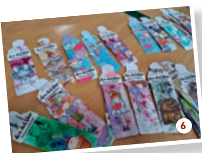
6. IES Estados del Duque, Ciudad Real.

IES Valle del Saja, IES José Hierro, IES Santa Clara, IES Ría San Martín, IES Ricardo Bernardo.