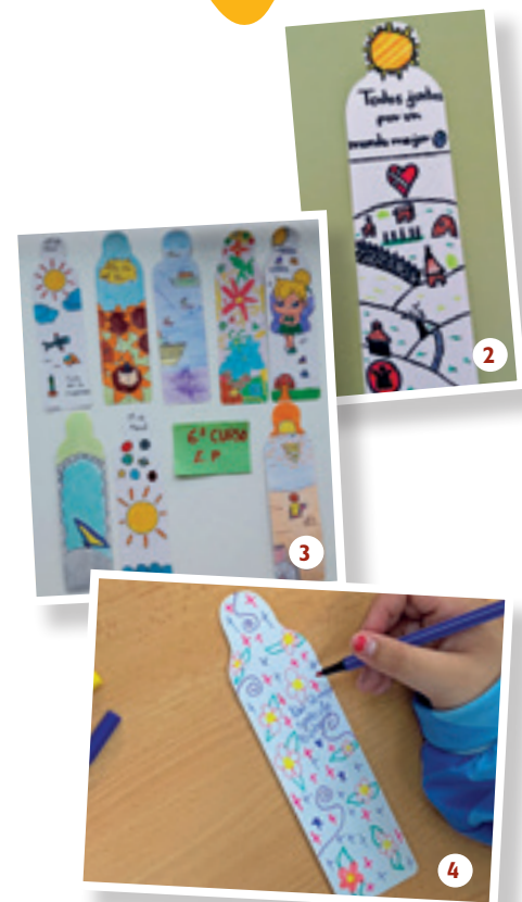
1. IES Mar Azul, Almería. 2. IES Delgado Hernández, Huelva. 3. Colegio Sagrado Corazón de Jesús, Jaén. 4. IES Pablo Picasso, Sevilla.