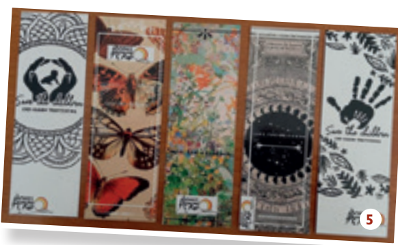
5. IES Domingo Rivero, Las Palmas.