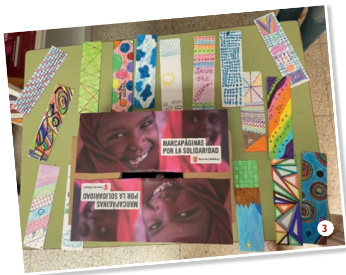
3. IES Torreón de Alcázar, Ciudad Real 4. IES Arenas de San Pedro, Ávila 5. CEIP Caja de Ahorros, Salamanca

COLEGIO APOSTOLADO DEL SAGRADO CORAZON DE JESUS | COLEGIO SAN ANTONIO | IES RICARDO BERNARDO.