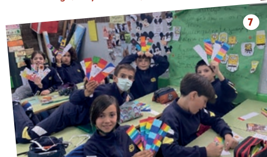
6. Colegio Albanta, Fuenlabrada, Madrid 7. Colegio Decroly, Madrid 8. IES José Saramago, Majadahonda, Madrid

COLEGIO NTRA. SRA. DE LAS NIEVES | GREENLEAVES MONTESSORI AMERICAN SCHOOL | EI SHANTALA | EITAKARA | COLEGIO SANTISSIMA TRINIDAD | COLEGIO HUMANITAS BILINGUAL SCHOOL TORREJON | CEIP CHOZAS DE LA SIERRA | IES FORTUNY | CEIP CARMEN HERNANDEZ GUARCH | IES SAN AGUSTIN DE GUADALIX | INTERNATIONAL COLLEGE SPAIN | COLEGIO VIRGEN DE LA VEGA | EI NANOS | CEE MONTE ABANTOS | CEIP JOSE MARIA DE PEREDA | COLEGIO SAN FRANCISCO | IES DE GUADARRAMA | COLEGIO DECROLY | COLEGIO INTERNACIONAL EUROVILLAS | CEI CABAS | IES JOSE SARAMAGO | CEIP VIRGEN DE LA NUEVA | COLEGIO ALBANTA | COLEGIO LOPE DE VEGA | IES SANTAMARCA | CEIP NTRA. SRA. DEL CASTILLO | CRA VEGA DE TAJUÑA | COLEGIO BRITISH COUNCIL SCHOOL (BRITANICO) | CEIP INFANTA ELENA | COLEGIO INGENIO | CEIP CIUDAD DE MADRID | EI EL OSITO | IES AVENIDA DE LOS TOREROS | IES ARQUITECTO PEDRO GUMIEL | EI BETARIA.