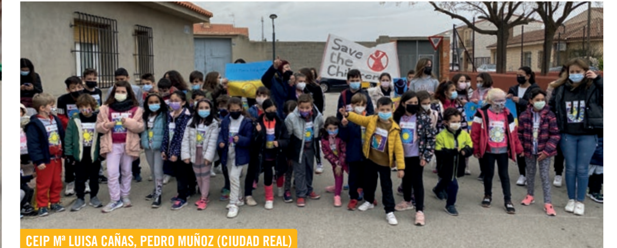
CEIP M a LUISA CAÑAS, PEDRO MUÑOZ (CIUDAD REAL)

Save the Children ha estado presente en Ucrania desde 2007 y opera en el este del país desde 2014. A lo largo de 8 años de conflicto, hemos estado entregando ayuda humanitaria esencial a los niños y sus familias. En Ucrania hemos atendido más de 60.000 niños, proporcionando apoyo básico en materia de salud, educación, protección, agua y saneamiento, dinero en efectivo, refugio y servicios de salud mental. En total se han establecido 11 Espacios Amigos para la Infancia.