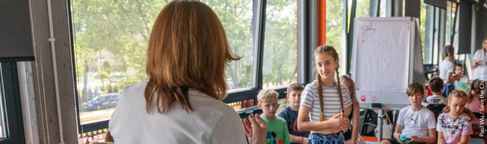
Paul Wu / Save the Children