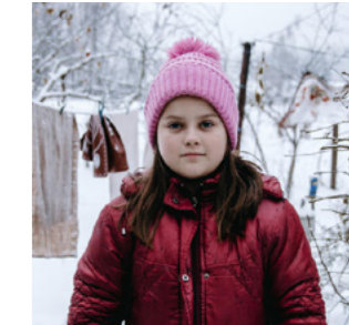
Oksana Parafeniuk / Save the Children