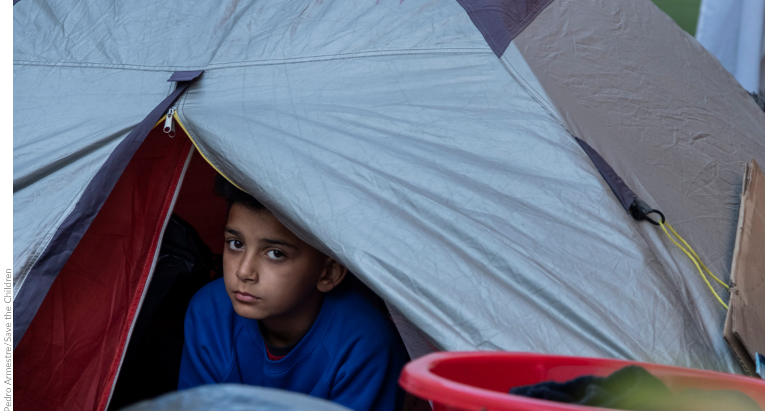
Pedro Armestre/Save the Children

2021eko uztailaren 2an, Lituaniak larrialdi-egoera deklaratu zuen, 2.000 iheslari eta asilo-eskatzaile baino gehiago herrialdera sartu zirenean Bielorrusiatik barrena. 55 Ondorenean, Lituaniako Parlamentuak atzerritarren estatutu juridikoari buruzko lege bat onartu zuen, eta “Lituaniar sartzeko baimenik ez zuten pertsonen asilo-eskaerak baztertzeko” erabili zen lege hori; horrez gain, “lurraldera nor sartuko zen erabakitze erabateko askatasuna” eman zien mugako guardiei. 56 Legedia haurrei ere aplikatu zitzaizen berriro ere, salbuespenik gabe. Asiloaren esparruko EBko legedia urratu arren, EBko goi-funtzionarioak mugako hesi bat eraikitze proposamenaren alde agertu ziren, eta Lituaniako gobernuaren ekimena goretsi zuten, “idea ona” iruditzen zitzaizela esanez. 57