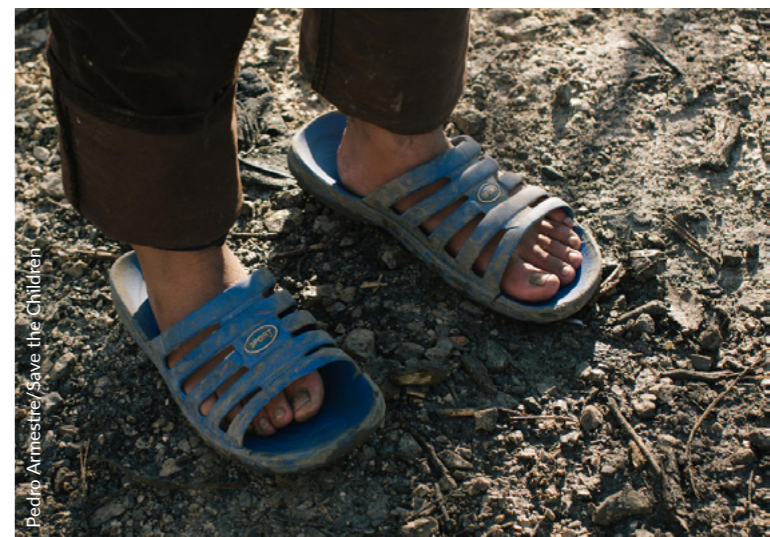
Pedro Armestre / Save the Children

Praktikan, jada gertatzen ari ziren horrelakoak, eta aurrez ere salatu izan zen nazioarteko babesa eskatzen ari ziren pertsonak Bielorusiara itzularazi zirela, 51 “basoan inguratuta zituzten pertsonak modu masiboan eta ilegalean kanporatuz”, 100 haur horien artean; horixe adierazi zuten Poloniako gizarte zibileko hainbat erakunde. 52 Polonian familiako kide bat ospitaleratu behar izan zutenean eta gainerakoak Bielorusiara itzularazi aurretik mugako guardiak familiak bereizi zituztela erakusten duten txosten fidagarriak ere badaude; emakume bat, esaterako, bere semearengandik bereizi zuten, 5 urteko haurarengandik. 53 2021eko irailaren 2an deklaratuak larrialdi-egoerak debekatu egin ziren kazetariei, behatzaileei, gizarte zibileko erakundeei eta iristen ari ziren iheslariak laguntzen ari ziren laguntza-taldeei muga inguruetan sartzea. 54