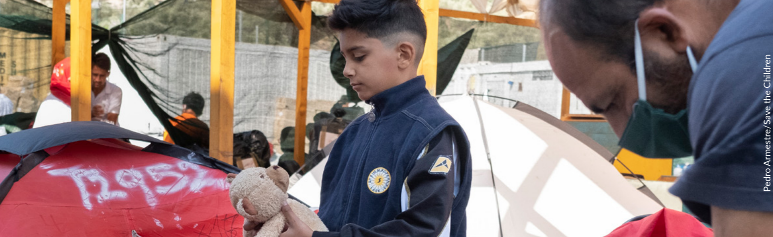
Pedro Armestre / Save the Children

jarduera horiek finantzaten dituzte. IOMk jakinarazi du 2021ean gutxienez 32.425 pertsona bidean atzeman eta Libiara itzularazi zituztela. 2022ko maiatzean, NBEk adierazi zuen 180 haur baino gehiago zeudela itsasoan atzitu eta Libiara itzularazi ziren 4.715 lagun artean. 40 Herrialde horretan torturatu eta atxilotutako adingabe iheslari eta migratzaileen zenbait kasu ere nabarmentzen zituen txostenak.