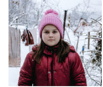
Oksana Parafeniuk / Save the Children