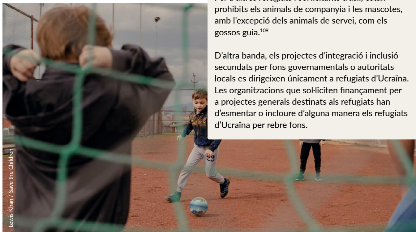
Lewis Khan / Save the Children

D'altra banda, els projectes d'integració i inclusió secundats per fons governamentals o autoritats locals es dirigeixen únicament a refugiats d'Ucraïna. Les organitzacions que sol·liciten finançament per a projectes generals destinats als refugiats han d'esmentar o incloure d'alguna manera els refugiats d'Ucraïna per rebre fons.