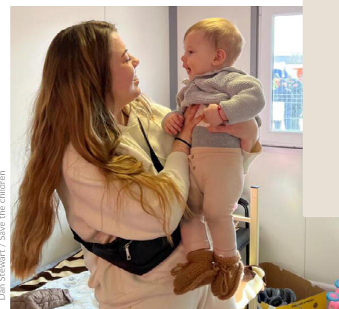
Dan Stewart / Save the Children

Mentre la UE negocia el Pacte sobre Migració i Asil, Save the Children fa una crida als responsables nacionals i de la UE perquè defensin els drets dels infants i garanteixin que a tots els menors que busquen seguretat a Europa se'ls ofereixen vies segures i legals per fer-ho, llibertat de circulació, protecció i suport per reprendre les seves vides.