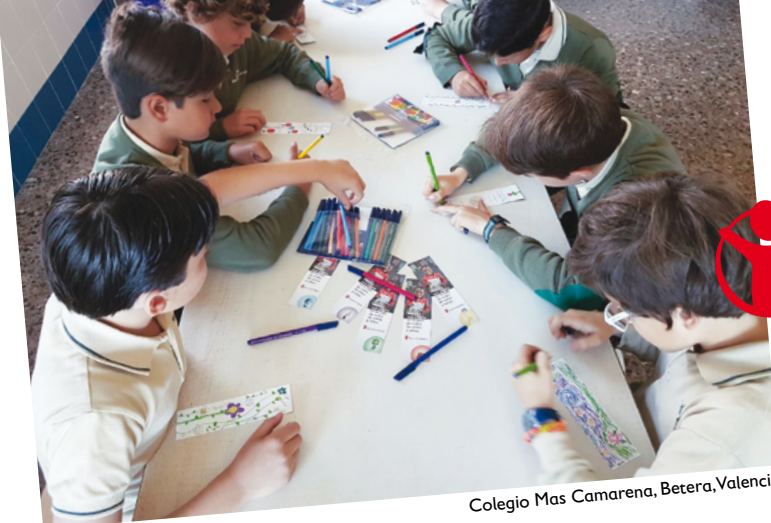
Colegio Mas Camarena, Betera, Valencia.