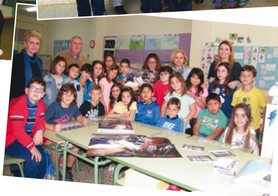
(1) CEIP Mar de Fora, Fisterra, A Coruña. (2) CEIP San Jerónimo Fuentes de Cesna, Granada. (3) CEIP Cervantes, Caravaca de la Cruz, Murcia.