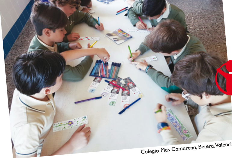
Colegio Mas Camarena, Betera, Valencia.