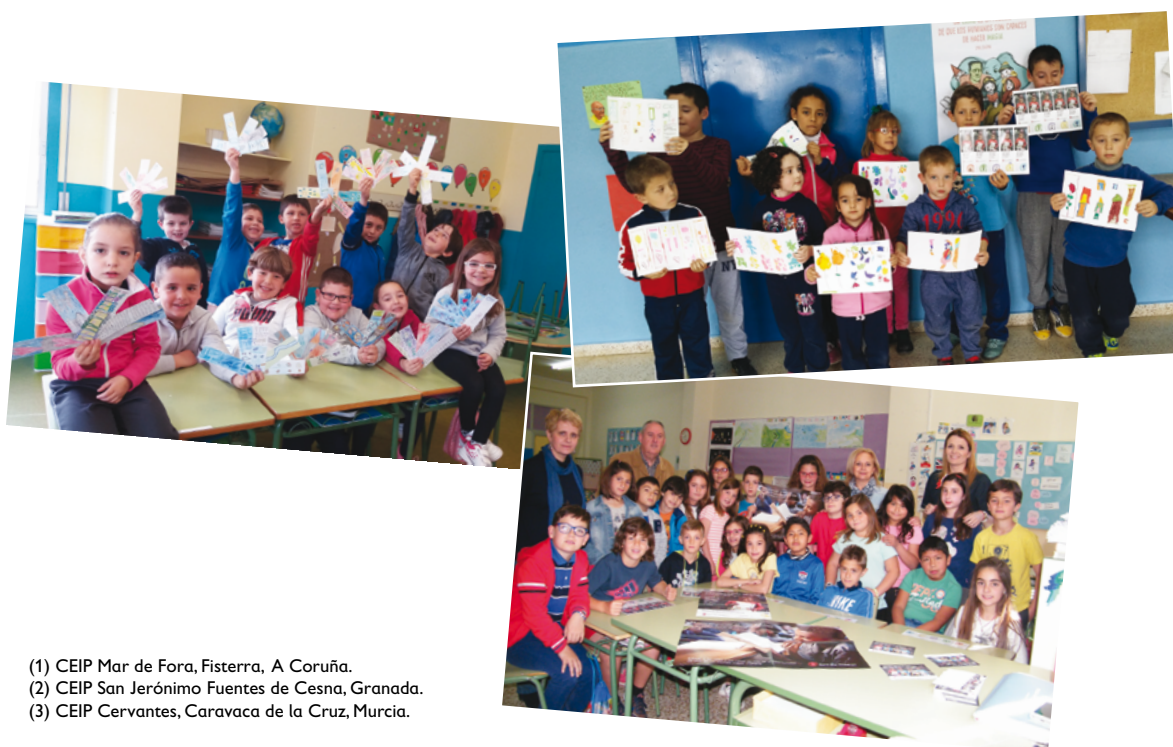
(1) CEIP Mar de Fora, Fisterra, A Coruña. (2) CEIP San Jerónimo Fuentes de Cesna, Granada. (3) CEIP Cervantes, Caravaca de la Cruz, Murcia.