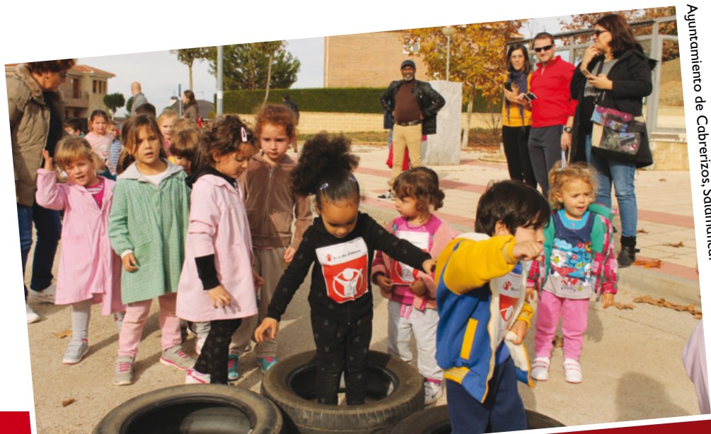
Ajuntamiento de Cabrerizos, Salamanca.

A través de la búsqueda de patrocinadores transforman el esfuerzo en fondos para hacer realidad los programas que nos permiten contribuir a que la vida de esos niños y niñas sea más fácil. Al esfuerzo físico se une el entusiasmo y compromiso con otros para alcanzar el objetivo común: la solidaridad con los niños y niñas más vulnerables.